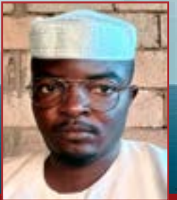
تقرير : محمد أمين

تكالب على البلاد الكثير من الطامعين في خيراتهم غير المحدودة