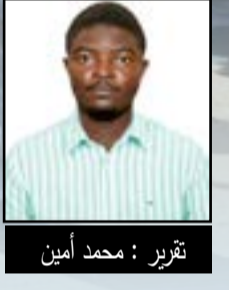
تقرير : محمد أمين