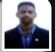
تقرير: نزار حسين