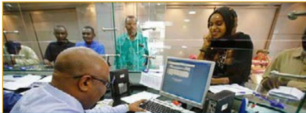
إن عملية تغيير العملة الوطنية حققت أكثر من هدف باعتبارها من الأمن القومي للملاد

هل سيؤثر تغيير العملة في ولاية الخرطوم على عجلة الاقتصاد في الولاية؟ - إن الهدف من تغيير العملة هو حصر التعامل النقدي وان يكون التعامل عبر التطبيقات البنكية والوسائل الإلكترونية وبطاقة الاستخدام عبر المنافذ ووسيلة الدفع بماكينه السداد والدفع الإلكتروني وكل هذا من اهم اسباب تغيير العملة ويعمل البنك المركزي على الشمول المالي ونشر ثقافة الدفع الإلكتروني، لأن السودان منذ عشرة أعوام لم يطور طريقة السداد وآخر الإنجازات كانت (اورنيك ١٥) وبعدها لم يحدث اي تطور لهذا النظام .