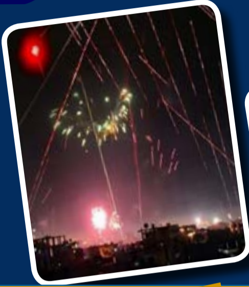
إستطلاع : هالة أزرق